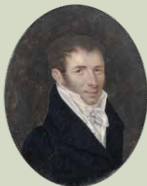
76 - Taille réelle