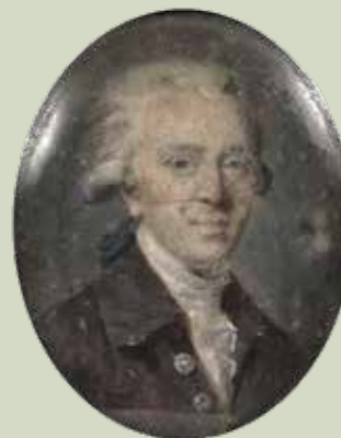
72 - Taille réelle