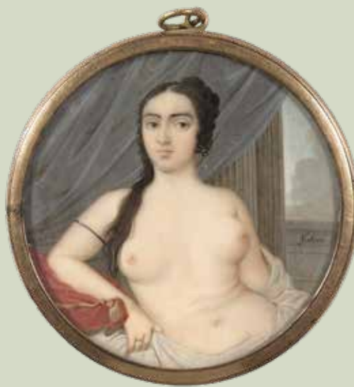
70 - Taille réelle