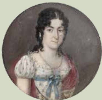
71 - Taille réelle

Descendance d'Hippolyte et Paul Flandrin