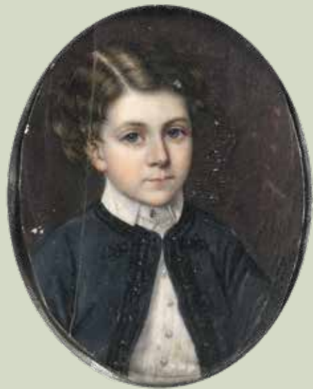
74 - Taille réelle