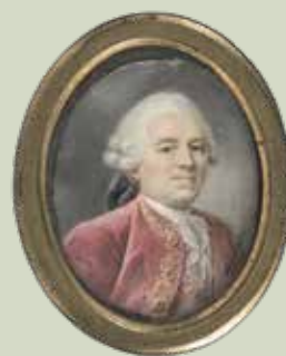
62 - Taille réelle