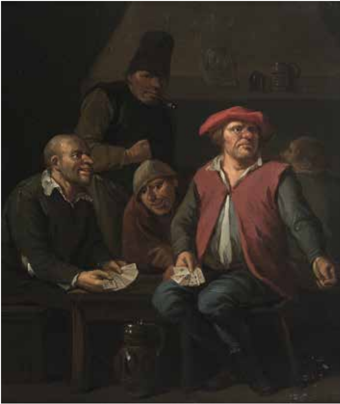
144 EGBERT VAN HEEMSKERCK (HAARLEM 1634? - LONDRES 1704) LES JOUEURS DE CARTES Panneau de chêne, une planche, non parqueté The card players, oak panel, one board, non cradled 18,50 X 16 CM - 7,3 X 6,3 IN.