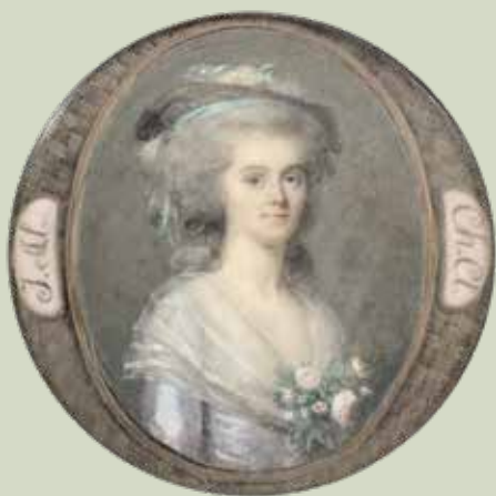
61 - Taille réelle