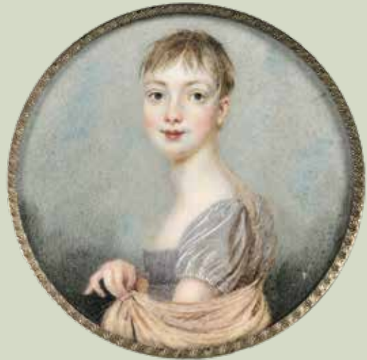
75 - Taille réelle