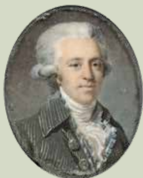
63 - Taille réelle