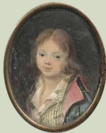
76 - Taille réelle