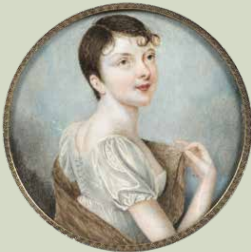
75 - Taille réelle