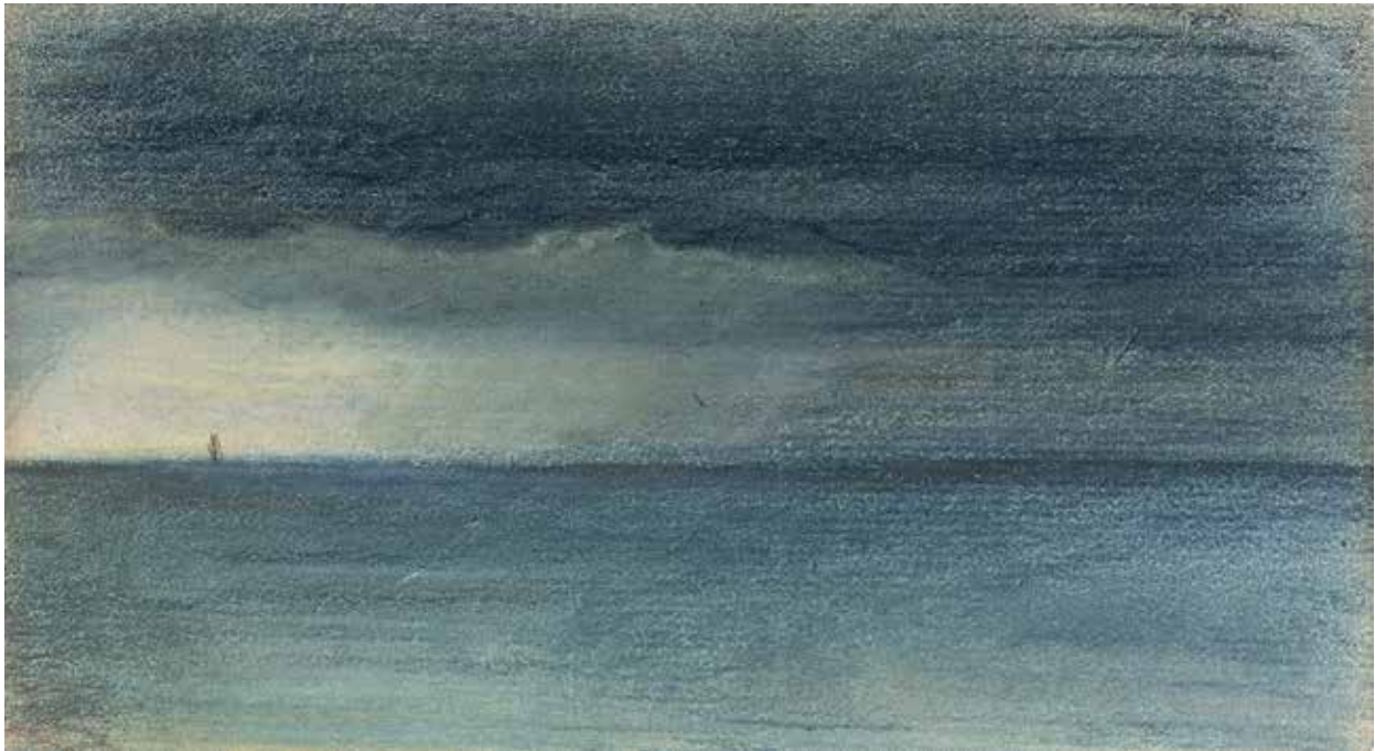
44 - taille réelle