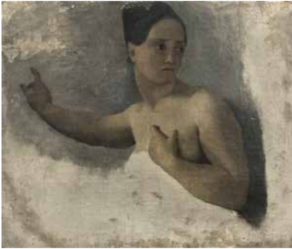
38 HIPPOLYTE FLANDRIN (1809-1864) ÉTUDE POUR MÉDÉE, PRIX DE ROME, 1832 Huile sur toile Ancienne étiquette au revers: H. Flandrin/Étude pour la/Médée/ Prix de Rome 1832 Accidents et restaurations Study for Médée, prix de Rome, canvas, old label on the back: H. Flandrin/ Étude pour la/Médée, accidents and restorations