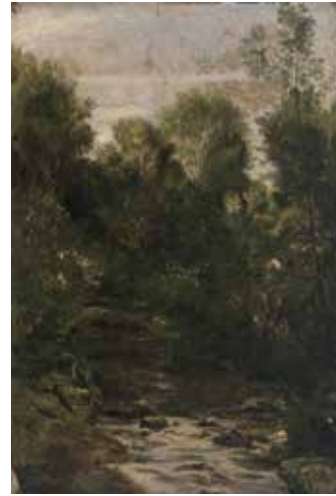
57 PAUL FLANDRIN (1811-1902) LA RIVIÈRE DE L'ALABARINE AU PLATEAU D'HAUTEVILLE DANS LE BUGEY, 1840 Huile sur papier marouflé sur carton Signé en bas à gauche: Paul Flandrin Inscriptions à l'encre brune au revers: L'Albarine près P/teau d'Hauteville/ Bugey Ain/Paul Flandrin 1840 Sans cadre Déchirures et manques The Alabarine River at the Hauteville Plateau in the Bugey, oil on paper mounted on cardboard, signed on the lower left, without frame, tears and lacks 32,50 X 22 CM - 12,8 X 8,7 IN.