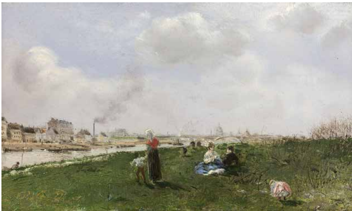
172 - Taille réelle