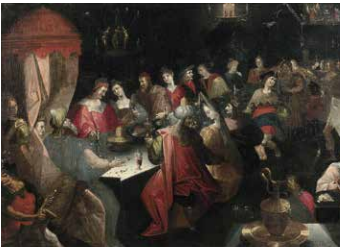
131 ÉCOLE ALLEMANDE DU XVII E SIÈCLE, ATELIER DE BARTHOLOMÄUS STROBEL LE FESTIN DE BALTHASAR