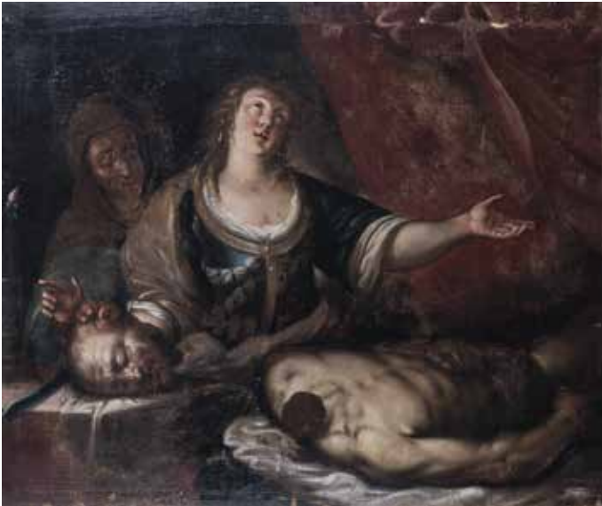
130 ÉCOLE ALLEMANDE VERS 1630 JUDITH ET HOLOPHERNE ; LE RENIEMENT DE SAINT PIERRE