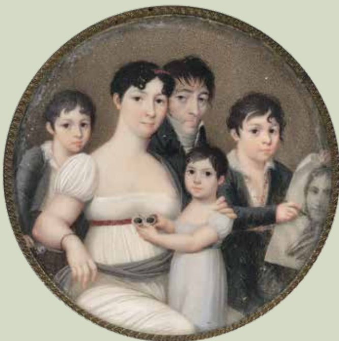
69 - Taille réelle