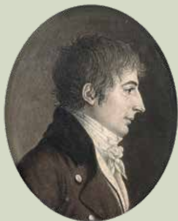
65 - Taille réelle