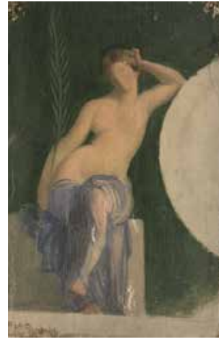
39 HIPPOLYTE FLANDRIN (1809-1864) ESQUISSE POUR LE PLAFOND DU CHÂTEAU DE DAMPIERRE, ÉTUDE DE FIGURES Huile sur toile Signée en bas à gauche: H. Flandrin Petits manques Sans cadre Sketch for the ceiling of The castle of Dampierre, study of figures, canvas, signed on the lower left: H. Flandrin, small lacks, without frame 18 X 12 CM - 7,1 X 4,7 IN.